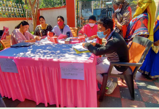
मेगा स्वास्थ्य शिविर का एक दृश्य

आम्रपाली-चन्द्रगुप्त क्षेत्र में 02 मार्च तथा पिपरवार क्षेत्र में 03 मार्च को सीएसआर योजना के अंतर्गत निःशुल्क 'मेगा स्वास्थ्य शिविर' का आयोजन किया गया जिसमें लगभग 2 हजार लोगो ने चिकित्सीय सेवा का लाभ लिया। स्वास्थ्य शिविर में हड्डी रोग, शिशु रोग, स्त्री रोग, नेत्र रोग सहित कान नाक गला, दाँत रोग आदि विशेषज्ञों ने आसपास के ग्रामीण अंचलों के लोगो की चिकित्सीय जाँच कर उचित परामर्श देने के साथ-साथ मरीजो को निःशुल्क दवाईयाँ भी उपलब्ध कराई। स्वास्थ्य शिविर मे केंद्रीय अस्पताल गांधीनगर एवं विभिन्न क्षेत्रीय अस्पतालों के 15 विभिन्न विभागों के 30 विशेषज्ञ डॉक्टरों एवं पारा मेडिकल स्टाफ ने मेगा स्वास्थ्य शिविर का सफल संचालन किया।