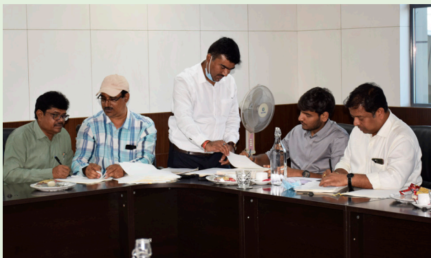
समझौता ज्ञापन का एक दृश्य

सेन्ट्रल कोलफील्ड्स लिमिटेड, स्टेकहोल्डर्स के समावेशी विकास के लिए प्रतिबद्ध है। सस्टेनेबल माइनिंग हेतु कंपनी के इस कार्य को और बल देने की दिशा में चंद्रगुप्त खुली खदान परियोजना सीसीएल के लिए एक मील का पत्थर साबित होगी। ज्ञातव्य हो कि हजारीबाग जिले में 1495 हेक्टेयर क्षेत्र में फ़ैले इस मेगा प्रोजेक्ट की वार्षिक क्षमता 15 मिलियन टन (एमटी) होगी। इस परियोजना के माध्यम से 25 वर्षों में 339.30 एमटी नॉन-कोकिंग कोयले का संचयी उत्पादन हासिल किया जाएगा।